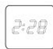
4 w 1 LCD